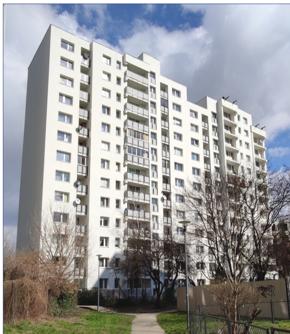
H. Junkiewicz 2, po wykonanym remoncie

Spółdzielnia sukcesywnie prowadzi prace rewitalizacyjne mające na celu ograniczanie różnic pomiędzy budynkami powstałymi w poprzednich dekadach a wysokimi standardami nowoczesnego budownictwa. W tym celu według współczesnych wzorców zrealizowano remonty klatek schodowych podobnie, jak niedawno w budynku przy ulicy Kołowej 4. Zakres re-