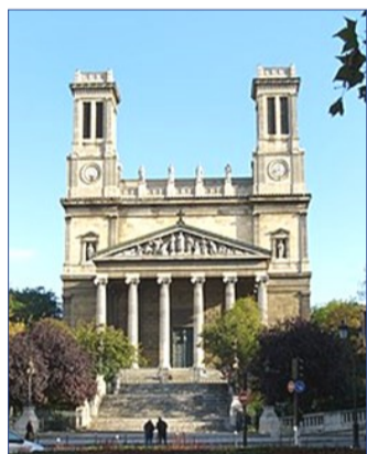
Kościół św. Wincentego a Paulo w Paryżu w miejscu domu Św. Łazarza

na swego przywódcę i starał się przełożyć przesłanie Ewangelii na konkretne rezultaty.