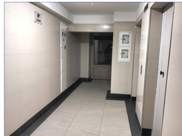
Kołowa 4, klatka schodowa po remoncie