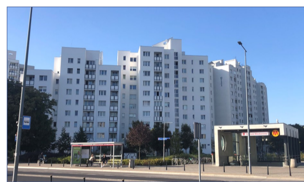
Prażłowska 8, po wykonanym remoncie