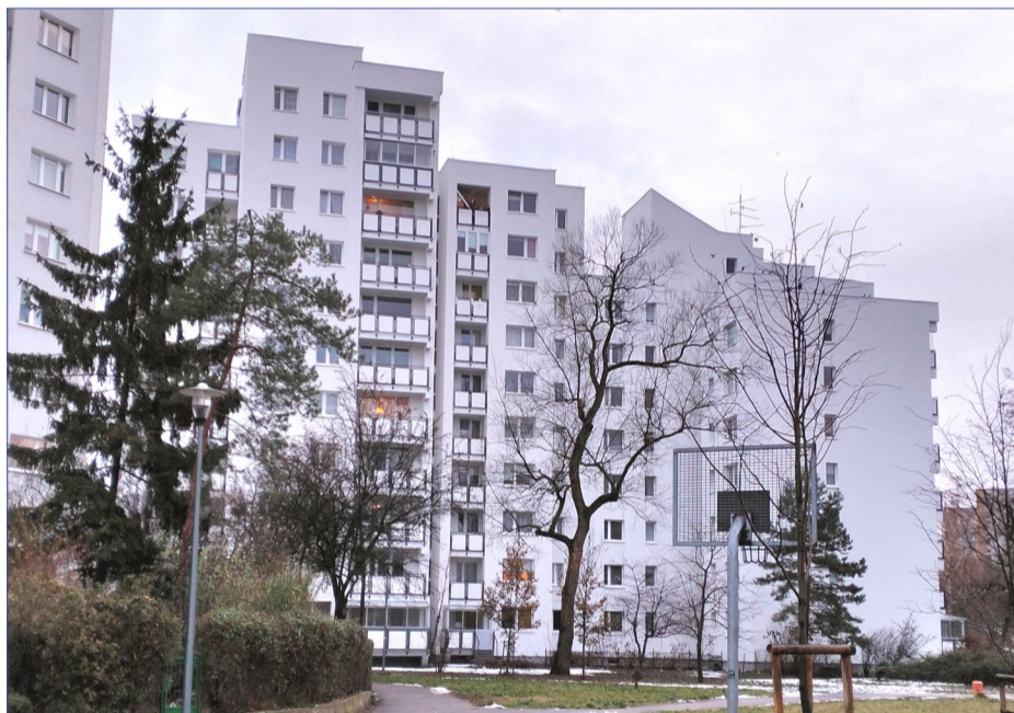
Prażłowska 8, po wykonanym remoncie