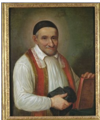
Święty Wincenty a Paulo Vincent de Paul

Kontynuując cykl o patronach ulic Osiedli Robotniczej Spółdzielni Mieszkaniowej „Praga”, odsłaniamy postać Świętego Wincentego. Brzmiąca po polsku nazwa ulicy mylnie sugeruje, że mowa tu o Polaku.